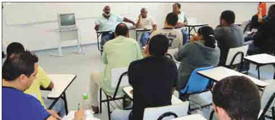
Mobilização em Santo Antônio de Jesus para debater a pauta dos trabalhadores