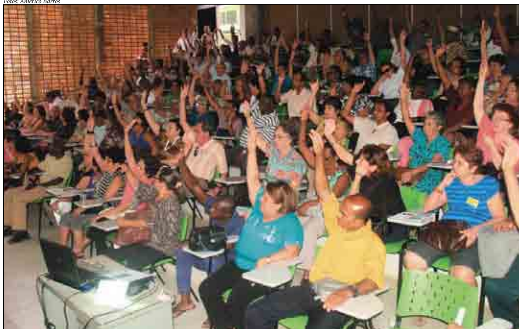
Assembleia referenda resultado da pesquisa: sede social deve ser vendida

Realizada no dia 31 de Agosto na Faculdade de Arquitetura da UFBA, a Assembleia Geral convocada pela ASSUFBA Sindicato, deliberou, após amplo debate na categoria, pela venda da Sede social da Assufba.