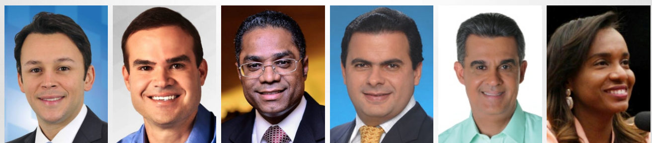
Mario Negromonte Jr (PP) dep.marionegromontejr@camara.leg.br Cacá Leão (PP) dep.cacaleao@camara.leg.br Márcio Marinho (PRB) dep.marciomarinho@camara.leg.br João Carlos Bacelar (PTN) dep.joaocarlosbacelar@camara.leg.br Sérgio Brito (PSD) dep.sergiobrito@camara.leg.br Tia Eron (PRB) dep.tiaeron@camara.leg.br

NÃO DEIXE QUE ELES VOTEM CONTRA VOCÊ. EXIJA QUE O SEU DEPUTADO VOTE CONTRA A REFORMA DA PREVIDÊNCIA