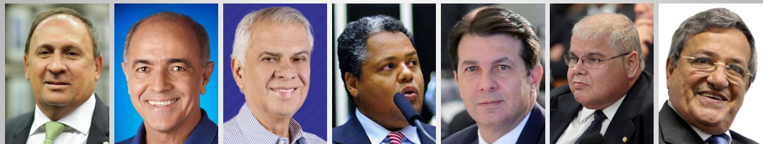
João Gualberto (PSDB) dep.joagualberto@camara.leg.br Aleluia (DEM) dep.josecarlosaleluia@camara.leg.br José Carlos Araújo (PSD) dep.josecarlosaraujo@camara.leg.br Antonio Brito (PTB) dep.antonibrito@camara.leg.br Arthur Maia (SD) dep.arthuroliveiram@camara.leg.br Lucio Vieira Lima (PMDB) dep.luciovieiralima@camara.leg.br Benito Gama (PTB) dep.benitogama@camara.leg.br